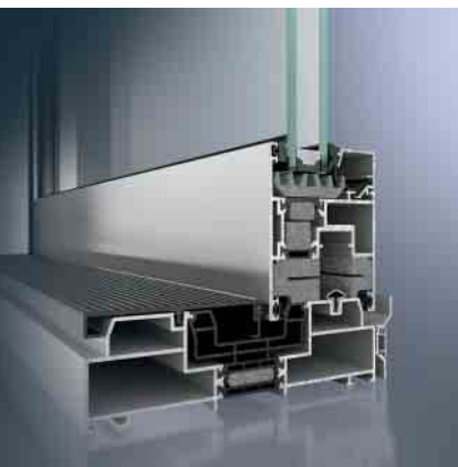
Schüco Hebe-Schiebesystem ASS 70.HI Schüco lift-and-slide system ASS 70.HI